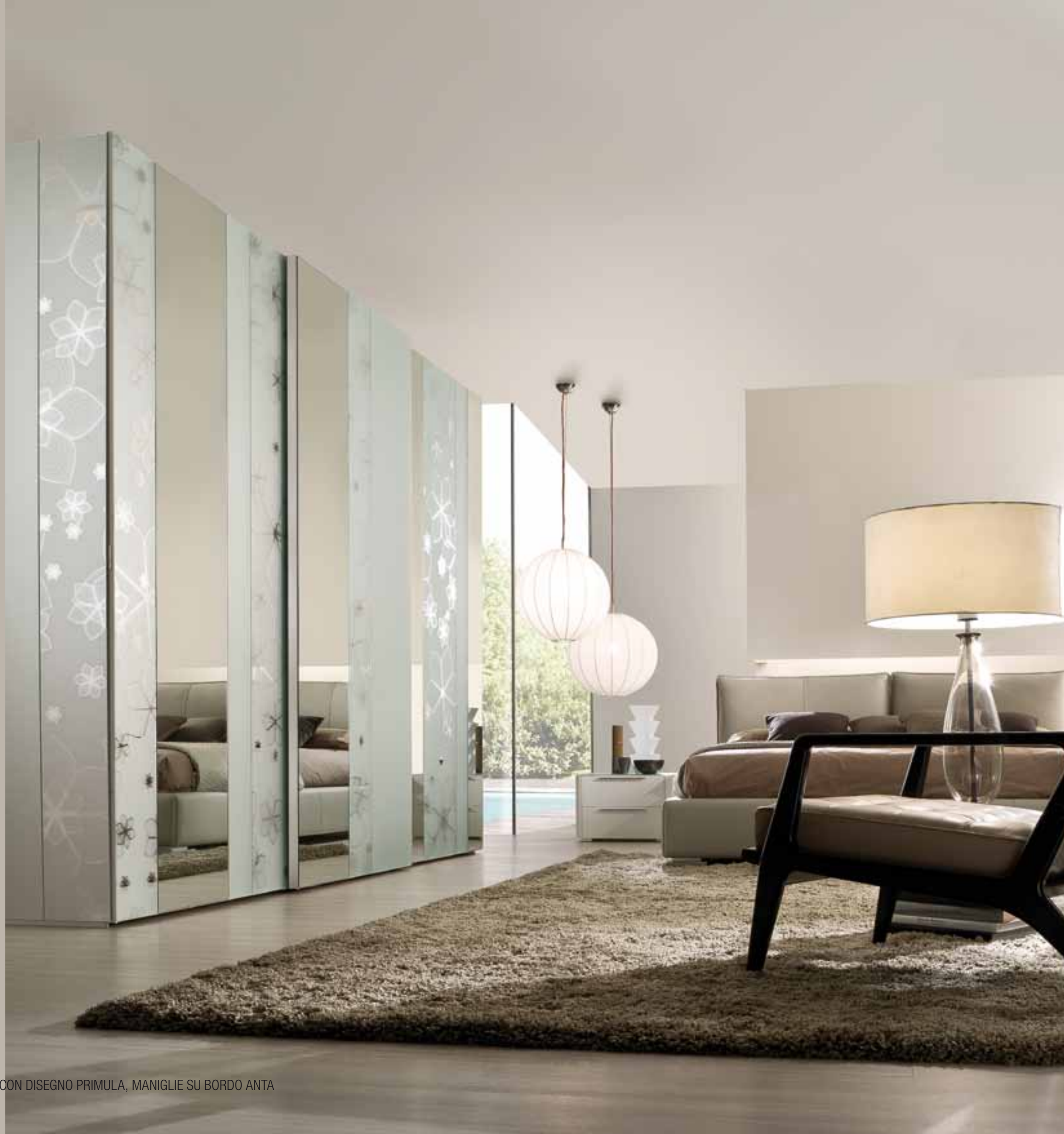
ARMADIO SCORREVOLE ESPACE 1, SPECCHI MISCELATI IN FASCE VERTICALI CON DISEGNO PRIMULA, MANIGLIE SU BORDO ANTA