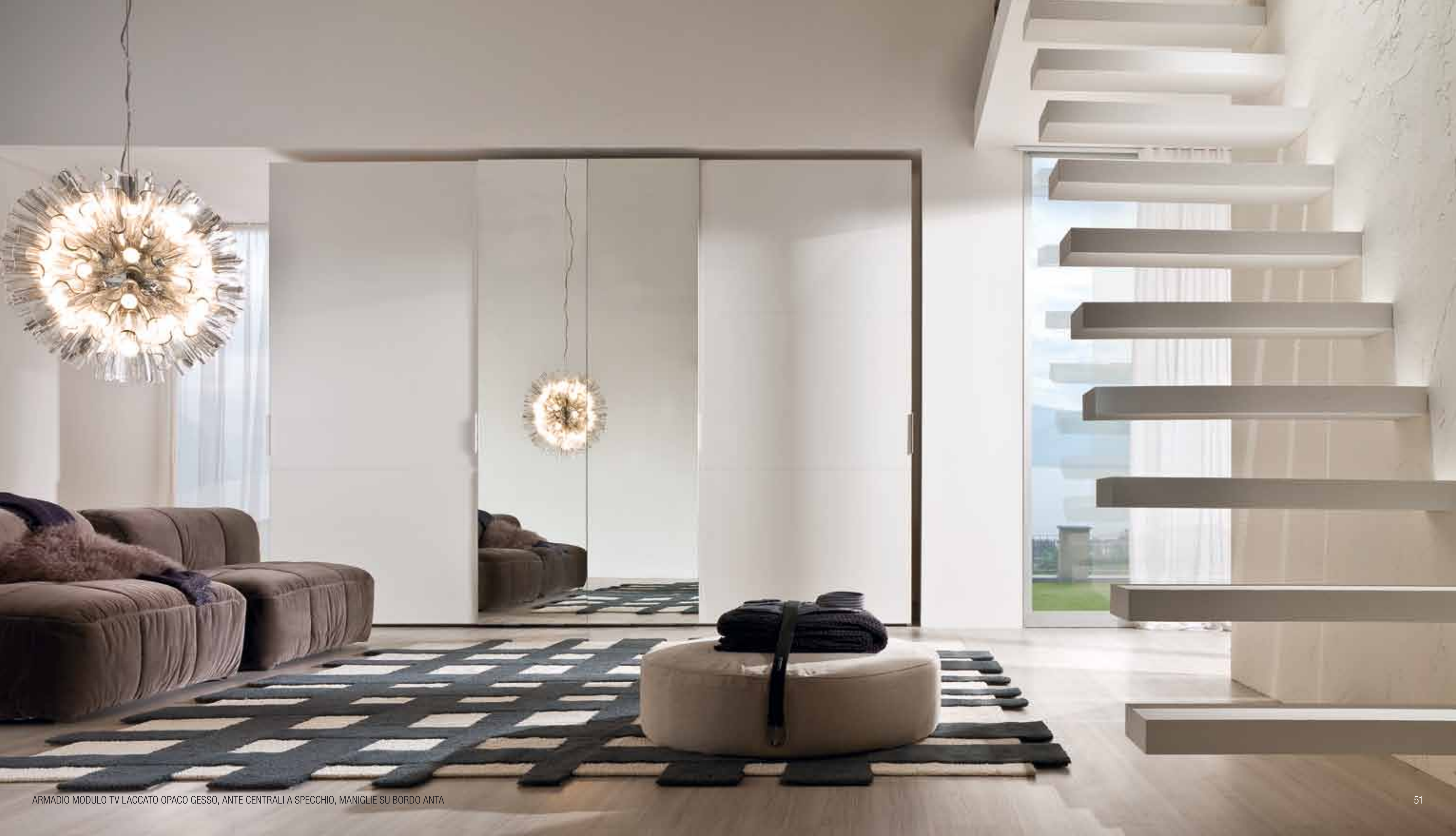
ARMADIO MODULO TV LACCATO OPACO GESSO, ANTE CENTRALI A SPECCHIO, MANIGLIE SU BORDO ANTA