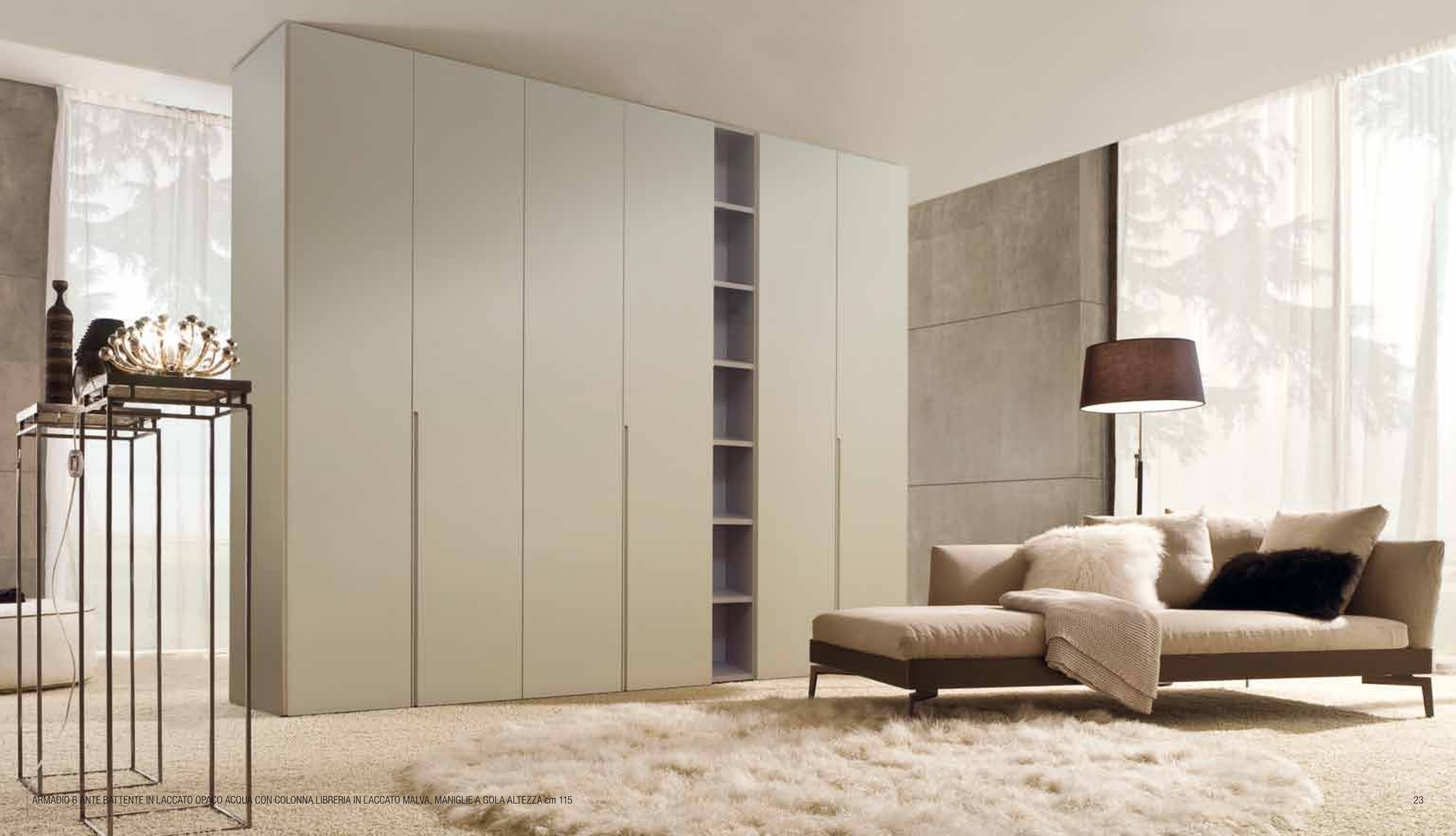
ARMADIO 6 ANTE BATTENTE IN LACCATO OPACO ACQUA CON COLONNA LIBRERIA IN LACCATO MALVA, MANIGLIE A GOLA ALTEZZA cm 115