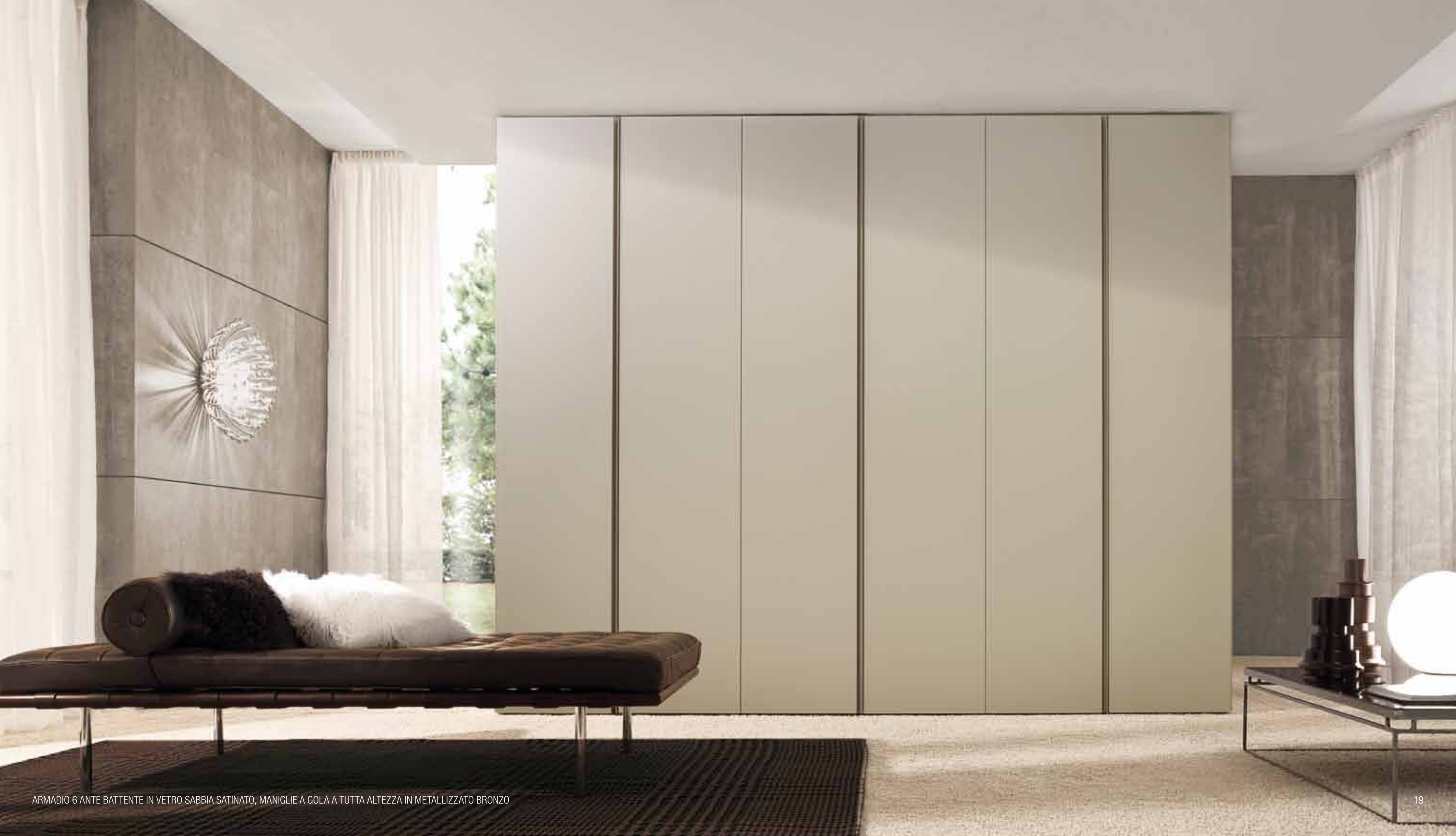
ARMADIO 6 ANTE BATTENTE IN VETRO SABBIA SATINATO, MANIGLIE A GOLA A TUTTA ALTEZZA IN METALLIZZATO BRONZO