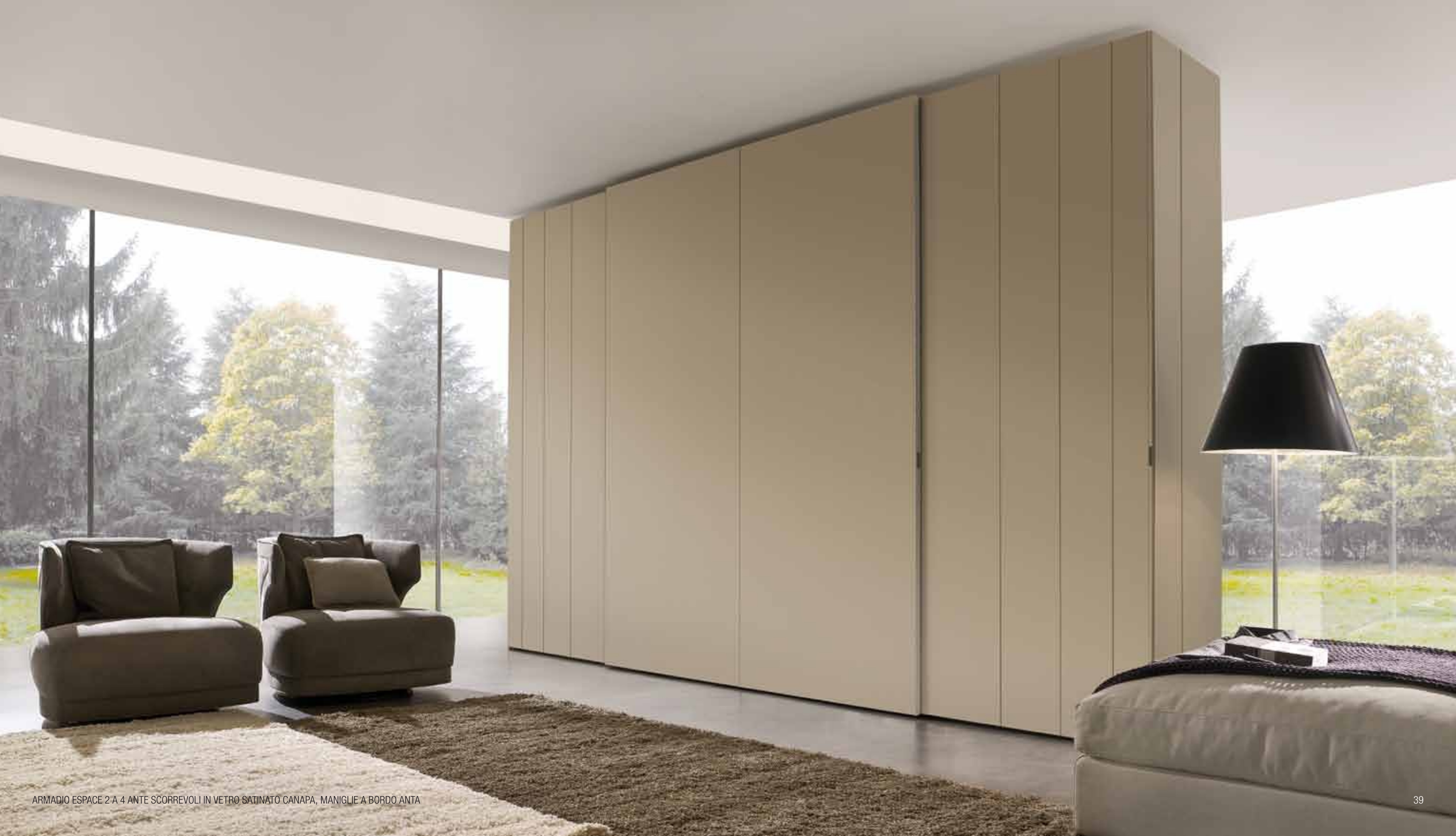
ARMADIO ESPACE 2 A 4 ANTE SCORREVOLI IN VETRO SATINATO CANAPA, MANIGLIE A BORDO ANTA