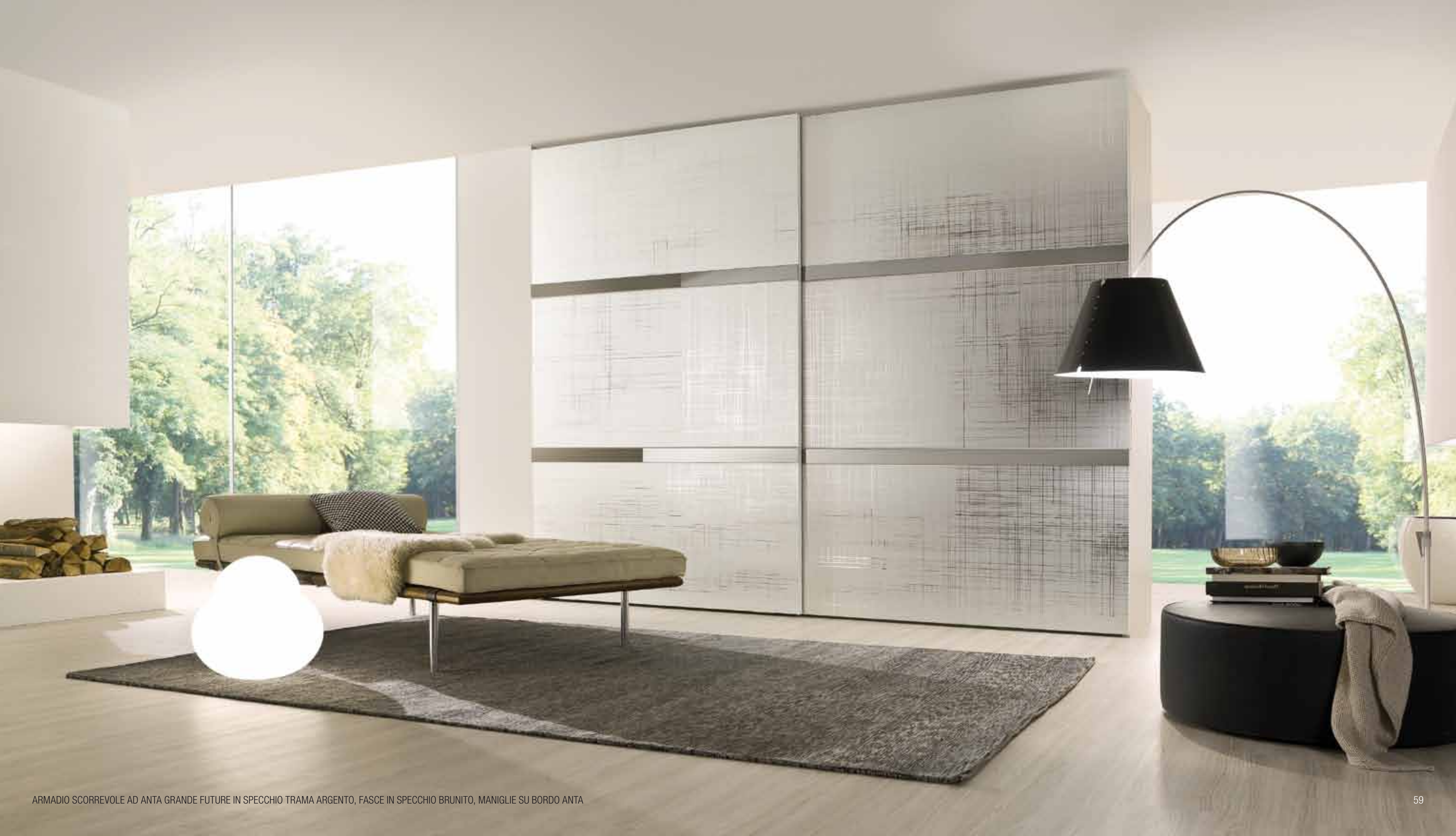
ARMADIO SCORREVOLE AD ANTA GRANDE FUTURE IN SPECCHIO TRAMA ARGENTO, FASCE IN SPECCHIO BRUNITO, MANIGLIE SU BORDO ANTA