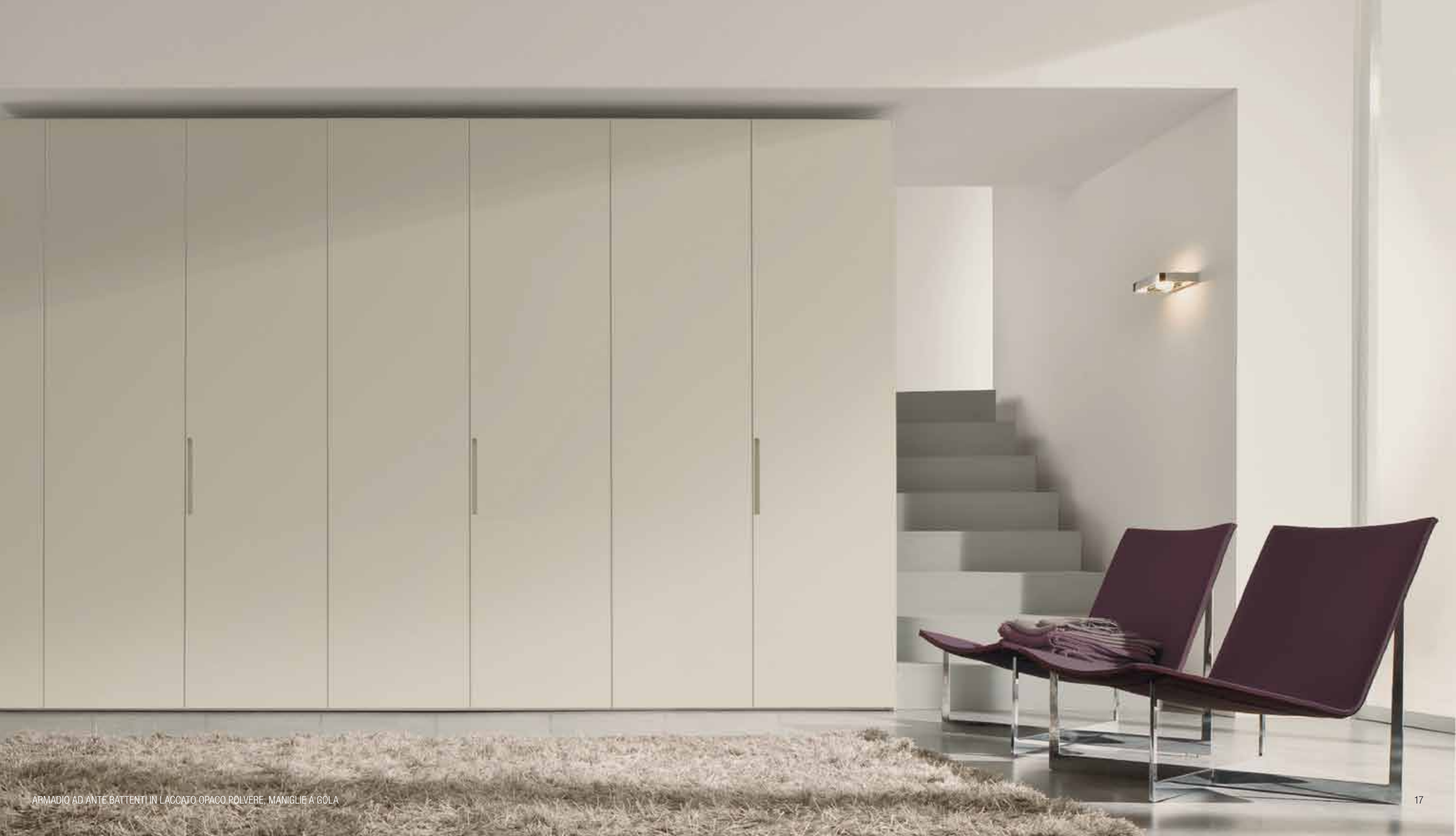
ARMADIO AD ANTE BATTENTI IN LACCATO OPACO POLVERE, MANIGLIE A GOLA