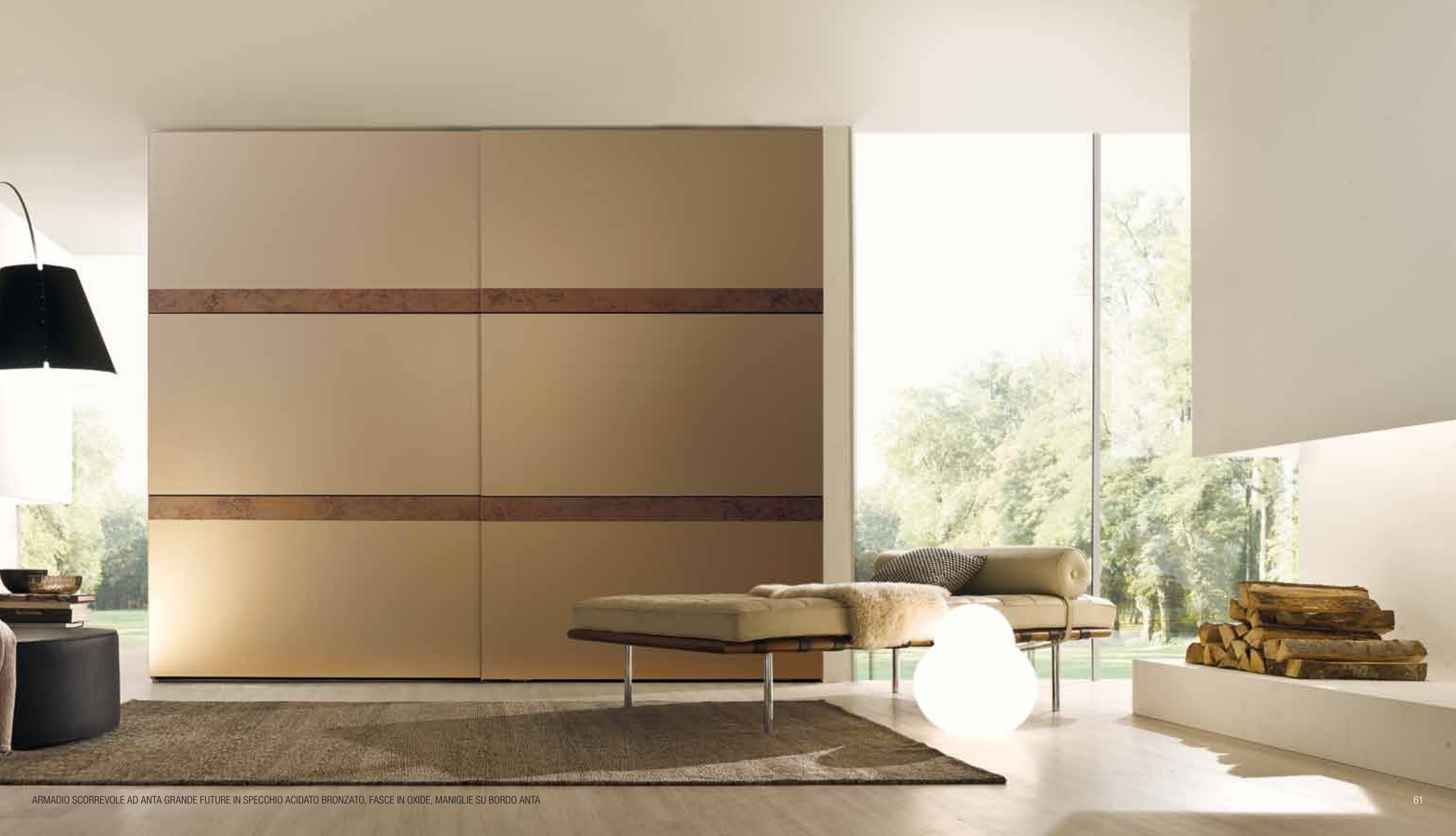
ARMADIO SCORREVOLE AD ANTA GRANDE FUTURE IN SPECCHIO ACIDATO BRONZATO, FASCE IN OXIDE, MANIGLIE SU BORDO ANTA