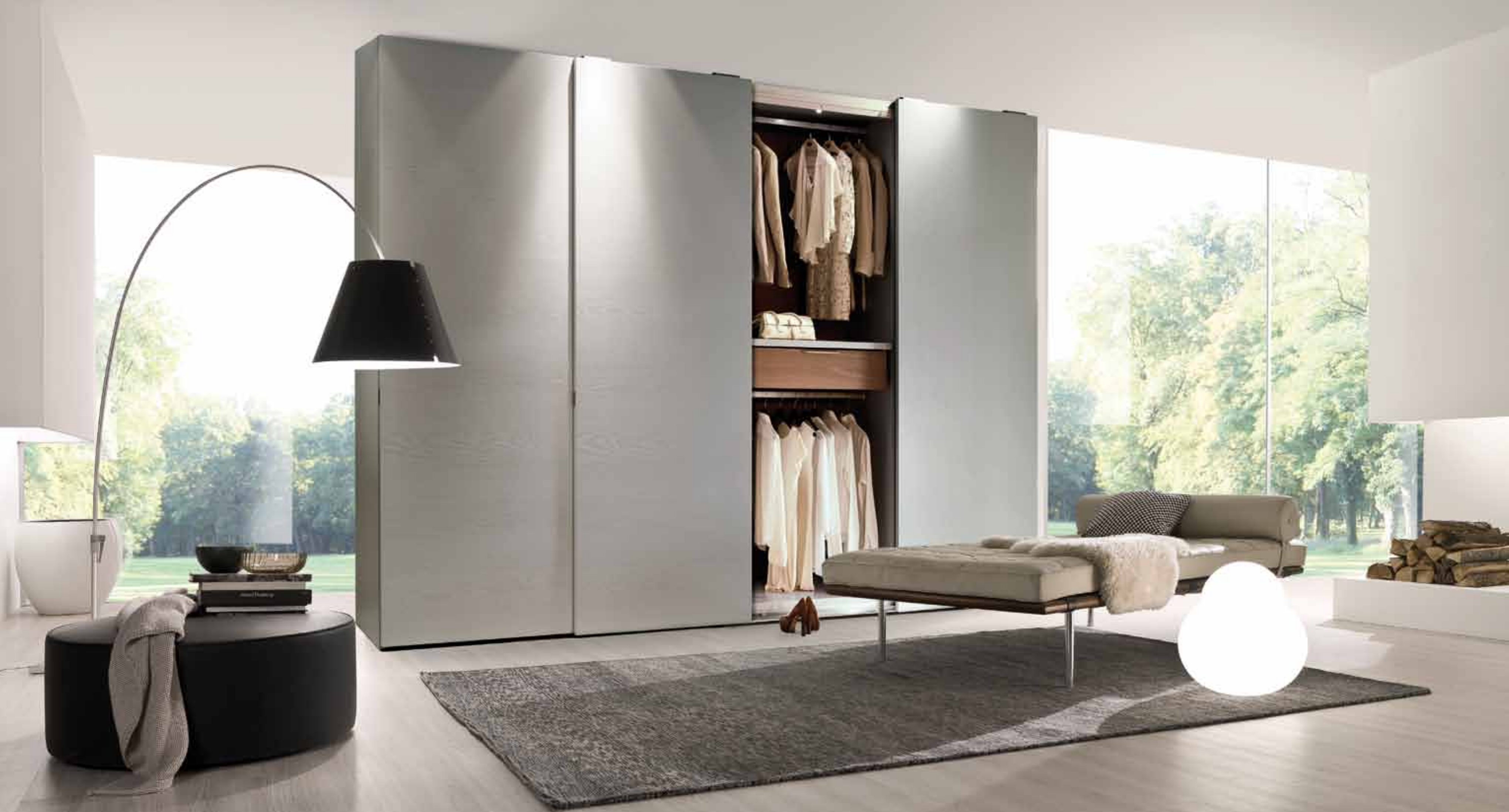
ARMADIO 4 ANTE SCORREVOLI IN LEGNO NATURALE LACCATO PORO APERTO LAGO, CON MANIGLIE A BORDO ANTA