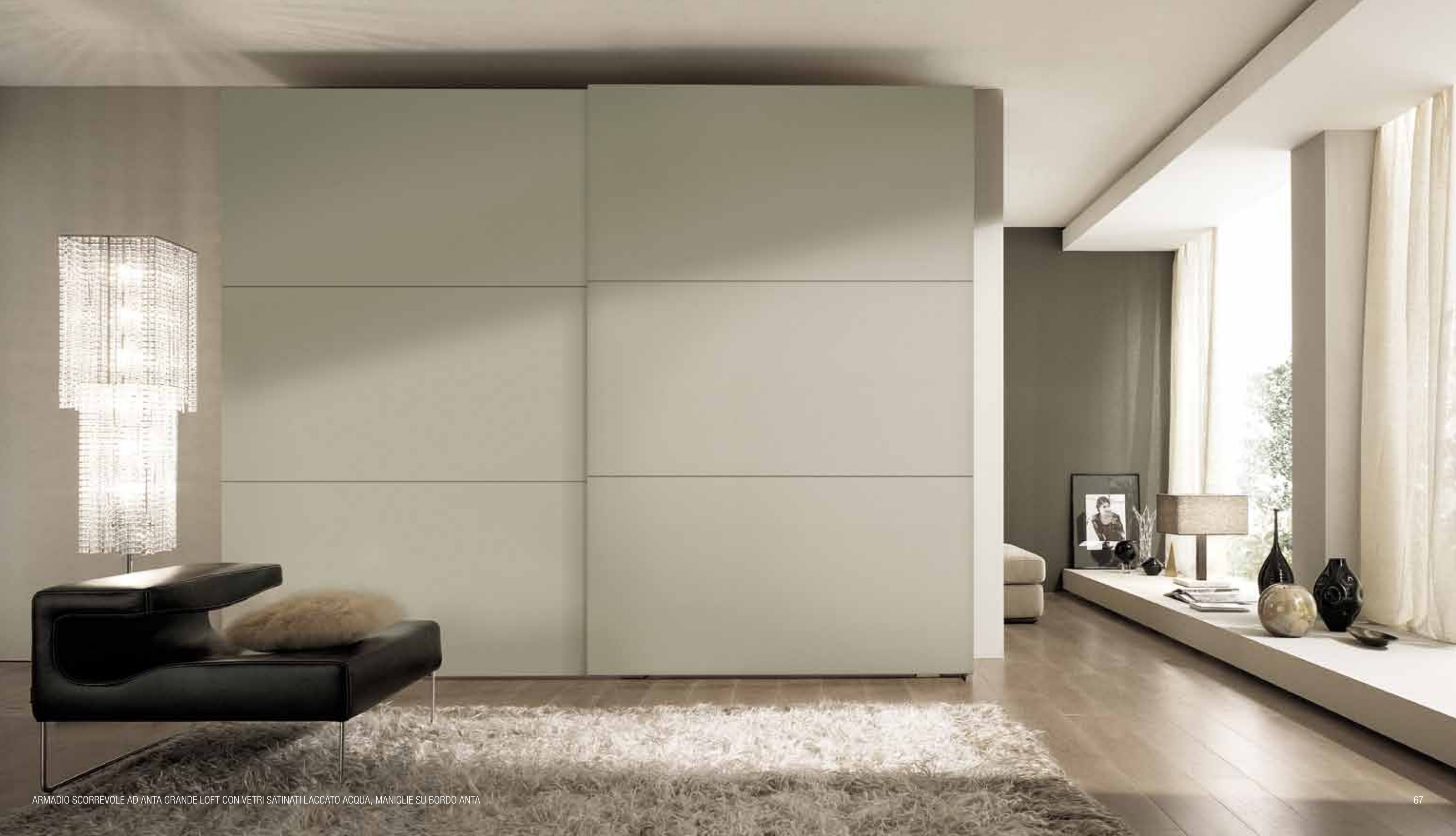
ARMADIO SCORREVOLE AD ANTA GRANDE LOFT CON VETRI SATINATI LACCATO ACQUA, MANIGLIE SU BORDO ANTA